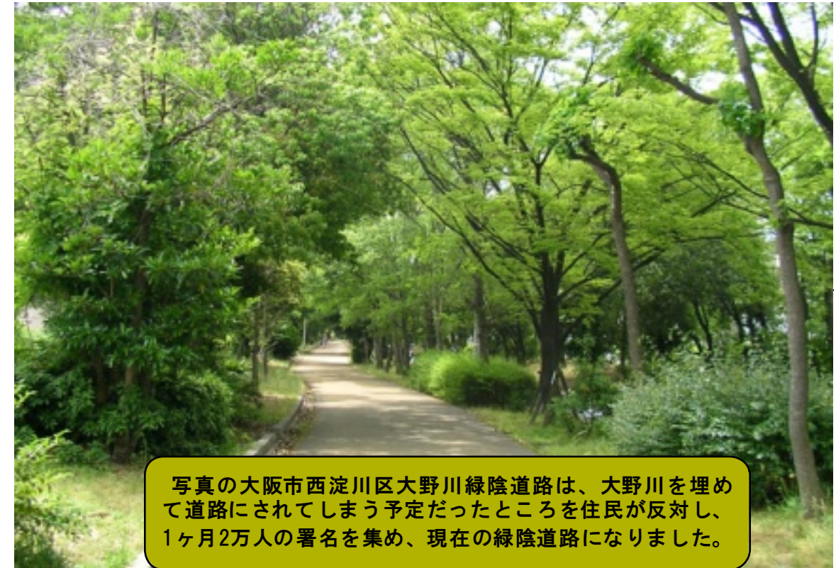
写真の大阪市西淀川区大野川緑陰道路は、大野川を埋めて道路にされてしまう予定だったところを住民が反対し、1ヶ月2万人の署名を集め、現在の緑陰道路になりました。

高い樹木の間を埋めるように 中木・低木が植わっている まるで小さな森が道の両脇に続く！