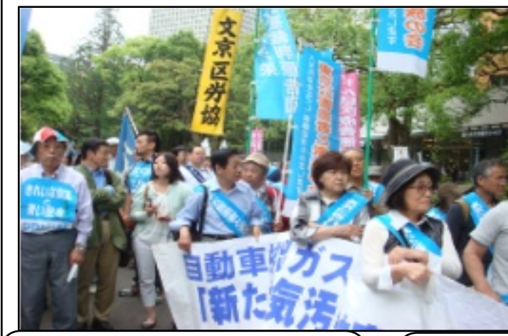
福島原発被害者のみなさん、今年 はバスを仕立てて大勢で参加しました