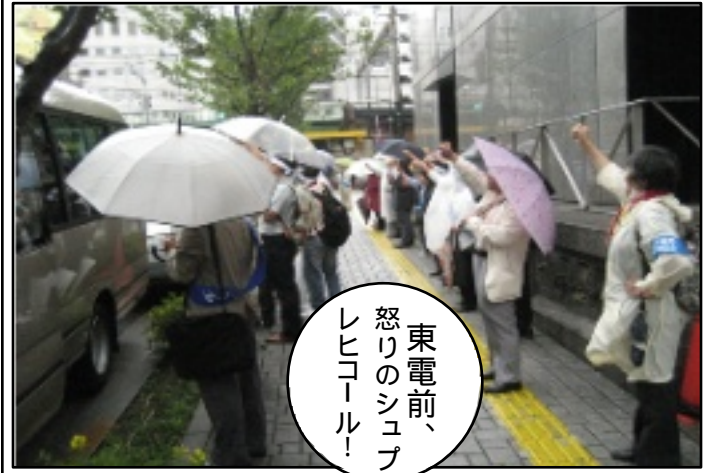
東電前、 怒りのシュプレ ヒコール！