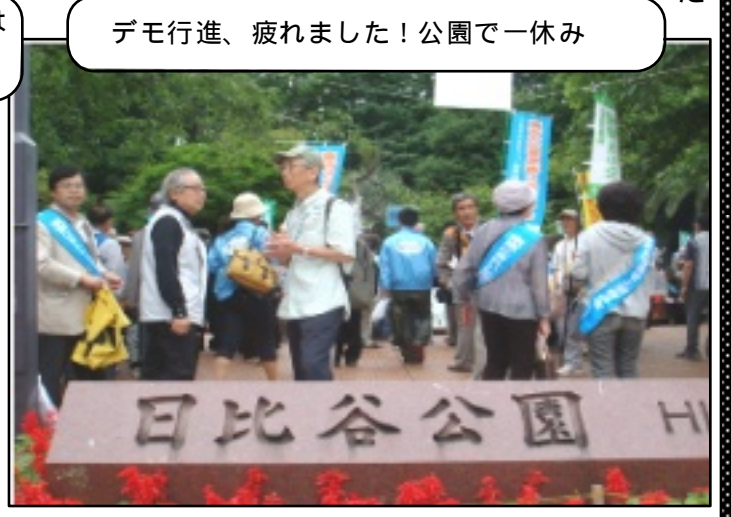
デモ行進、疲れました！公園で一休み